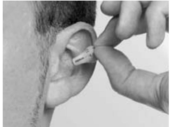
links: Polizist mit »Phonak« im Einsatz oben: Einsetzen eines »Phonak« ins Ohr rechts: Diese Art Ohrhörer mit durchsichtigem Spiralkabel wird von Personenschützern, aber nicht bei Observationen benutzt (zu auffällig)!