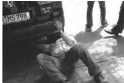
Ein GPS-Sender wird platziert, der Techniker wird durch zwei Observanten gesichert