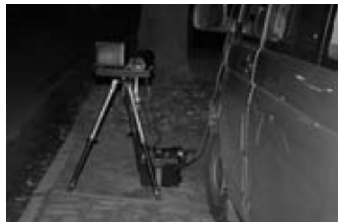
Zwei Kennzeichen-Scanner im Testeinsatz