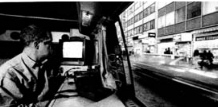
Beamter im Inneren eines getarnten Transporters (Aufriss). Das große Fenster rechts ist nach außen verspiegelt oder stark abgedunkelt

Zur Tarnung werden meistens Kleintransporter eingesetzt. Diese haben abgedunkelte oder mit Vorhängen verdeckte Seitenscheiben, vor allem dann, wenn sie mit Personen besetzt sind. Solche Fahrzeuge haben den Vorteil, sehr flexibel zu sein: Sie können im Zuge der Observation schnell den Ort wechseln. Wesentliches Merkmal fast aller dieser Fahrzeuge: Ihr Innenraum ist auch aus großer Nähe nicht einsehbar, obwohl er nicht völlig fensterlos ist. Entweder die Scheiben sind stark verdunkelt, nicht selten zusätzlich mit Vorhängen dahinter, die aufgrund der Verdunkelung nicht zu erkennen sind. Für die Verdunkelungswirkung ist nicht das Licht entscheidend, das von vorne auf die Scheibe fällt, sondern die komplette Abdichtung des Innenraumes und die Hintergrundbeleuchtung - die Stärke einer Verdunkelung ist also am besten anhand einer hellen Lichtquelle hinter dem Fahrzeug zu erkennen. Oder die Scheiben sind durch Vorhänge o. ä. verdeckt, die einen kleinen Spalt aufweisen oder es werden »venezianische Spiegel« verwandt, also einseitig verspiegelte Flächen, die sich meistens nicht direkt an der Scheibe befinden, um weniger aufzufallen. Gut geeignet dafür sind bspw. kleine Fensterluken zwischen Laderaum und Fahrerraum eines Kleintransporters. Der Nachteil bei verdunkelten Scheiben ist der Lichtverlust, weshalb Kameras aus solchen Fahrzeugen nur tagsüber bei guten Lichtverhältnissen eingesetzt werden können und bei Einbruch der Dämmerung meistens entfernt werden.