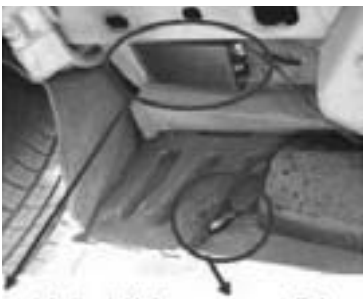
Montage eines GPS-Senders neben dem hinteren Radkasten, in diesem Fall GPS-Empfangsantenne (ganz unten) vom Rest des Moduls getrennt