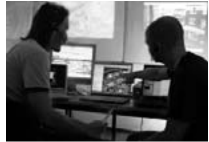
MEK-Beamte bei der Einsatzplanung

Ein Observationstrupp führt wöchentlich Teambesprechungen durch. Dabei werden neue Fälle vorgestellt und der Plan für die Observation entwickelt: Wer führt den Obs-Trupp vor Ort, der Truppleiter selbst oder ein nachgeordneter Beamter? Wie viele Personen und Autos werden für den Fall eingesetzt, welche Arbeitszeiten und wie viele Tage sind angesetzt, welche technischen Mittel werden eingesetzt, wer schreibt den Observationsbericht... Von nun an wird der eigentliche Sachbearbeiter oder die Sachbearbeiterin des Falles zwar über den Fortgang der Ermittlung informiert, ist aber selbst nicht mit vor Ort. Im Gegenteil, Observationstrupps lassen sich nur ungern von den KollegInnen aus der Schreibtischabteilung bei der Arbeit stören.