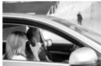
MEK-Beamte im Observationseinsatz

Wenn die Zielperson auftaucht, ist es zuerst wichtig, sie für alle ObservantInnen eindeutig zu beschreiben, damit alle sie von jetzt ab sofort erkennen. Das übernimmt die A-Position, die sich danach meist erst einmal etwas zurückhält, weil sie der ZP aufgefallen sein könnte.