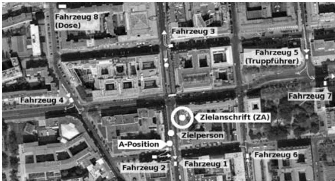
Abb. 4: Bewegung zu Fuß. Die ZP verlässt das Haus und geht zu Fuß zum Eingang U-Bahnhof. Fahrzeug 1 (A-Position) entfernt sich sicherheitshalber, falls die ZP am U-Bahn-Eingang vorbeigeht. Fahrzeug 2 setzt (durch die Hausecke verdeckt) einen Fuß ab, der der ZP entgegengeht, und rollt langsam vor zur Kreuzung um zu sehen was passiert. Fahrzeug 2 und sein Fuß übernehmen damit die A-Position. Fahrzeug 3 setzt ebenfalls einen Fuß ab, der sich zum U-Bahnhof begibt. Fahrzeug 3 und die anderen Fahrzeuge setzen sich langsam in Bewegung. Solange die weitere Bewegung der ZP unklar ist, rollen sie in Richtung einer der vier möglichen U-Bahn-Richtungen, um nötigenfalls "vorzuziehen". Fahrzeug 8 ("Dose") wartet noch ab.