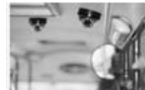
Vor allem die wenig auffälligen Kamera-»Dome« werden im Stadtbild immer häufiger

- Über die Zunahme öffentlicher Videokameras und die Weiterentwicklung von biometrischer Software kann es möglich werden, die Bewegung einer Person durch die Straßen der Stadt zu verfolgen. Die automatisierte Identifizierung von Personen per Video ist zwar theoretisch weit fortgeschritten, in der Praxis aber noch zu fehleranfällig. Praktisch wird das auf absehbare Zeit für Observationen nur am Rande eine Rolle spielen, weil der personelle Aufwand zur Auswertung dieser Daten in Echtzeit recht hoch ist. Solche Überwachungstechniken werden eher für Ermittlungen im Nachhinein wichtiger werden.