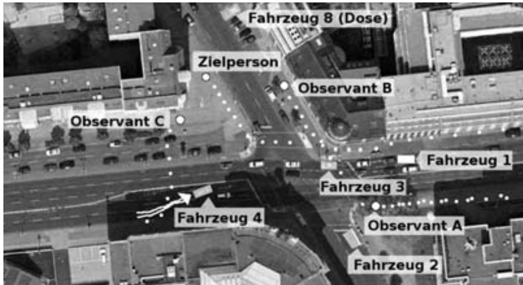
Abb. 8: Bewegung zu Fuß. Die ZP hat die Querstraße überquert und ist nach rechts eingebogen. Observant B ist auf der anderen Straßenseite geblieben und geht leicht nach hinten versetzt als A-Position mit. Observant A verweilt noch auf der Hauptstraße, um "abzukühlen". Observant C (aus Fahrzeug 4) ist, mit einigermaßen ausreichender Deckung (durch Entfernung und Hausecke), ausgestiegen und über die Straße geeilt, um Observant B zu unterstützen und Observant A zu entlasten. Fahrzeug 4 zieht zur Kreuzung vor, um in die Querstraße einzubiegen. Fahrzeug 2 wartet noch an der Ampel, um ebenfalls im Straßenverlauf zu folgen. Die Fahrzeuge 1 und 3 fahren im fließenden Verkehr langsam über die Kreuzung, biegen aber vorsichtshalber nicht rechts ab. Fahrzeug 8 (Dose) hat sich genähert und in der Querstraße eingeparkt. Wenn die ZP vorbeikommt, soll ein gutes Foto gemacht werden.