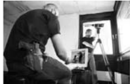
MEK-Beamte beim Einsatz in einer Konspirativen Wohnung

Wagen mit anderweitig versteckten/getarnten Kameras in einem ansonsten offenen Innenraum sind zwar unauffälliger, haben aber den Nachteil, dass die Kamera nach jeder Bewegung des Fahrzeugs neu auf das Ziel ausgerichtet werden muss. Solche Wagen werden deshalb dann eingesetzt, wenn es darum geht, über längere Zeit das Kommen und Gehen an einer festen Zielanschrift aufzuzeichnen. Hier ergibt sich das Problem von Speicherkapazitäten und Batterieleistungen, insbesondere im kalten Winter, weshalb solche Fahrzeuge regelmäßig betreut werden müssen. Üblicherweise wird eine stationäre Kamera so nah wie nur irgend möglich und sicherheitstechnisch vertretbar am Zielobjekt postiert, um Sichtbehinderungen auszuschließen. Nur wenn es gar nicht anders geht, wird ein Kamerafahrzeug auf der anderen Straßenseite geparkt, denn der fließende Verkehr stört erheblich, und niemand ist vor Ort, um Beobachtungslücken zu überbrücken.