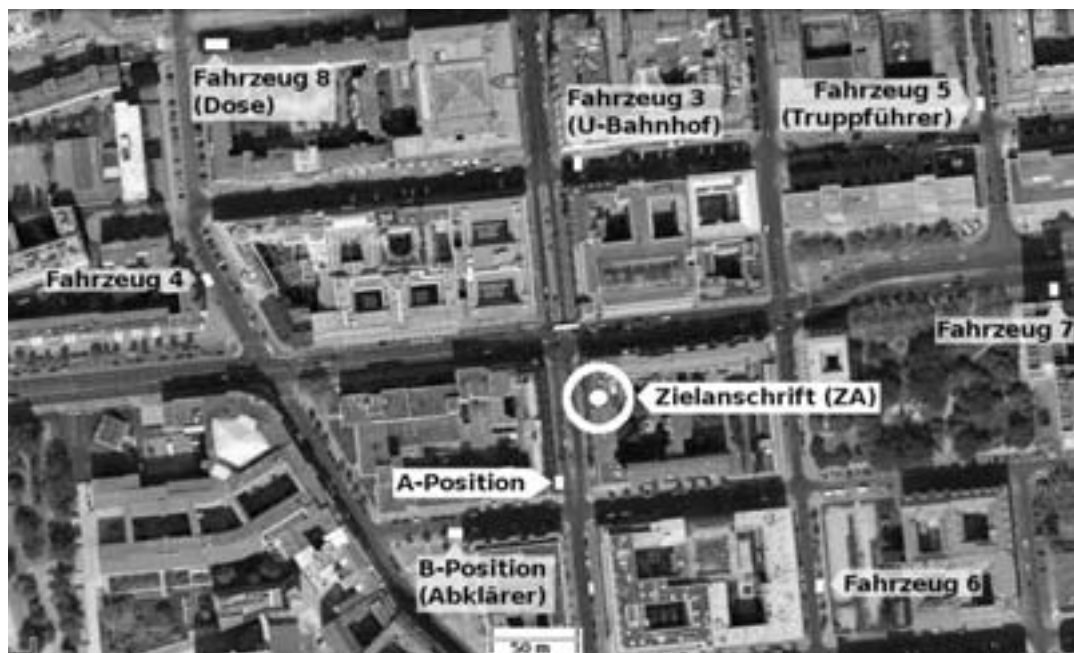
Abb. 3: Ausgangslage

Angenommen wird eine Observation mit 8 Fahrzeugen ohne KW. Die "Dose" (Fahrzeug 8) kann nicht sinnvoll postiert werden wegen Halteverbots, steht aber für etwaigen Bedarf in Bereitschaft im Nahbereich. Die A-Position wird von Fahrzeug 1 aus gemacht, das wegfahrbereit im Halteverbot steht. Um die Ecke steht Fahrzeug 2 in B-Position, um auf Signal von Fahrzeug 1 vorzuziehen (oder einen Fuß loszuschicken), falls eine interessante Person näher betrachtet werden soll. Fahrzeug 3 steht nahe des U-Bahn-Eingangs, falls die ZP den U-Bahnhof gleich gegenüber der ZA betreten sollte (Umsteigebahnhof mit 4 Richtungen!). Die übrigen Fahrzeuge verteilen sich verkehrsgünstig im Nahbereich. In Fahrzeug 5 (Truppführer) ist der Beifahrer mit einem Notebook ausgestattet, um Beobachtungen festzuhalten und ggf. online-Aktivitäten durchzuführen (z. B. Internet-Recherchen).