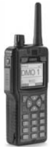
Aktuell verwendete TETRA-Geräte: Fest im Auto verbautes Handgerät; MRT (Basisgerät) von Motorola; HRT (Handgerät) von Sepura