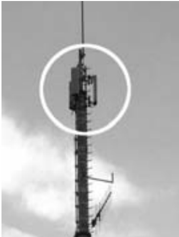
TETRA-Antenne (ähnelt stark Mobiltelefon-Antennen; charakteristisch sind drei Strahler)

Einige Fakten zu »Terrestrial Trunked Radio«: TETRA definiert ein digitales Funk-Verfahren, geschaffen von einem internationalen Firmen-Konsortium mit Sitz in Rom. Durch die Übernahme in Deutschland und weiteren EU-Ländern wird sich TETRA vermutlich als europaweiter digitaler Standard durchsetzen.