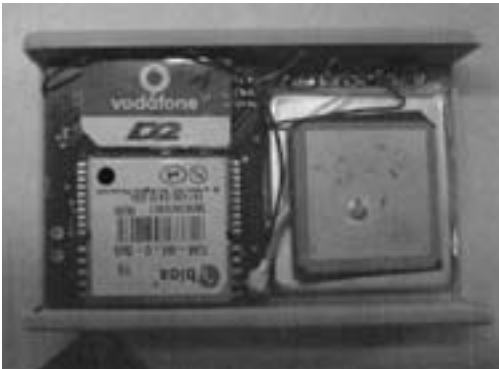
Innenansicht eines GPS-Tracking-Moduls. Links oben die GSM-Karte für die Übertragung der Daten per Mobilfunk