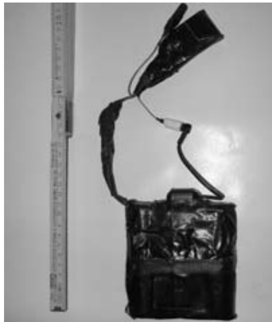
GPS-Sender vom BKA (2007), GPS-Antenne separat