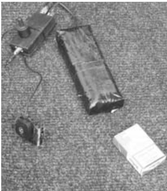
GPS-Sender vom LKA Schleswig-Holstein (2007), GPS-Antenne und Akku-Satz separat

Die beschriebenen Geräte lassen sich in alle Kraftfahrzeuge einbauen, Trackingmodule also grundsätzlich auch in Motorräder, wobei das schon etwas aufwändiger ist, weil es dort nur wenige in Frage kommende Verstecke gibt. Ganz schwierig ist es bei Fahrrädern, weil dort eigentlich nur das Verbergen im Rahmen möglich ist, was aufgrund der abschirmenden Wirkung des Metalls wenig erfolgversprechend ist. Alternativen könnten hier eine fest installierte Lichtanlage wie der Dynamo und Plastikteile mit Hohlräumen wie Reflektoren und Beleuchtung sein. Für eine ZP ist es aber leicht möglich, ein Fahrrad in kürzester Zeit auf Fremdkörper zu untersuchen. Eine Observation von Fahrrädern mit gängiger GPS-Peilung ist daher nahezu auszuschließen.