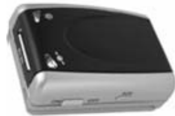
Vier klassische bzw. im Handel erhältliche GPS-Tracking-Module aus den Jahren 2007-2009. Hersteller: Links oben vermutl. Eigenbau mit externer GPS-Antenne, rechts oben Gmyrek, links unten Fugon, rechts unten Rettenegger