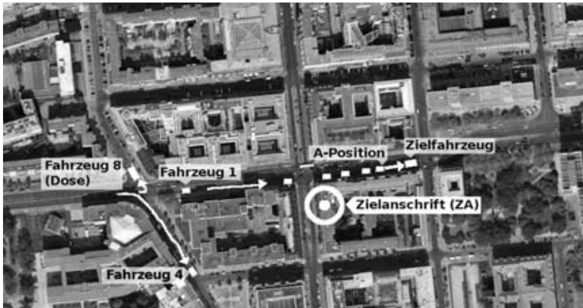
Abb. 6: Bewegung mit Auto. Das ZF kommt von einer Fahrt zurück in den Nahbereich der ZA. Es ist noch nicht klar, ob das ZF vorbeifahren oder einparken wird, eine Rückkehr zur ZA scheint aber wahrscheinlich. Die meisten Observationsfahrzeuge bleiben hinter dem ZF im fließenden Verkehr. Fahrzeug 4 schert aus und versucht, sich schon einmal ein gutes Plätzchen an der ZA zu verschaffen um das Eintreffen der ZP beobachten zu können. Fahrzeug 1 hat sich ans Ende der Kolonne fallen lassen, weil es der ZP früher am Tage aufgefallen sein könnte. Fahrzeug 8 (Dose) spekuliert darauf, dass die ZP nach Hause will und fährt zu seinem früheren Parkplatz.