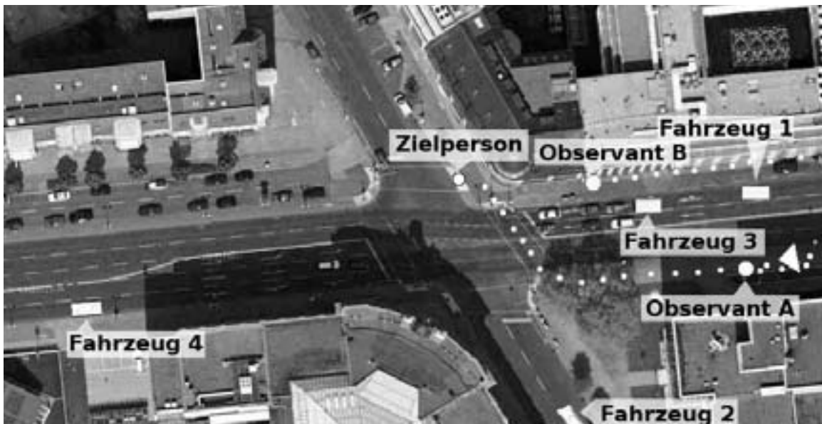
Abb. 7: Bewegung zu Fuß. Die ZP hat die ZA verlassen und geht die Hauptstraße entlang nach Westen (im Bild links). Observant A folgt auf derselben Straßenseite, Observant B auf der gegenüberliegenden Straßenseite. Die A-Position hat eigentlich A, aber B setzt auch Berichte ab. An der Kreuzung wechselt die ZP die Straßenseite und steht nun an der Ampel zur Überquerung der Querstraße. Observant B übernimmt nun die A-Position und schließt etwas auf. Observant A lässt sich sicherheitshalber etwas zurückfallen, bleibt aber auf dem Sprung. Die Fahrzeuge 1 und 3 sind der ZP möglichst langsam gefolgt, fahren aber jetzt im fließenden Verkehr mit. Fahrzeug 2 nähert sich aus der Seitenstraße und meldet gute Sicht auf die ZP. Fahrzeug 4 nähert sich von Westen und meldet ebenfalls Sicht auf die ZP.