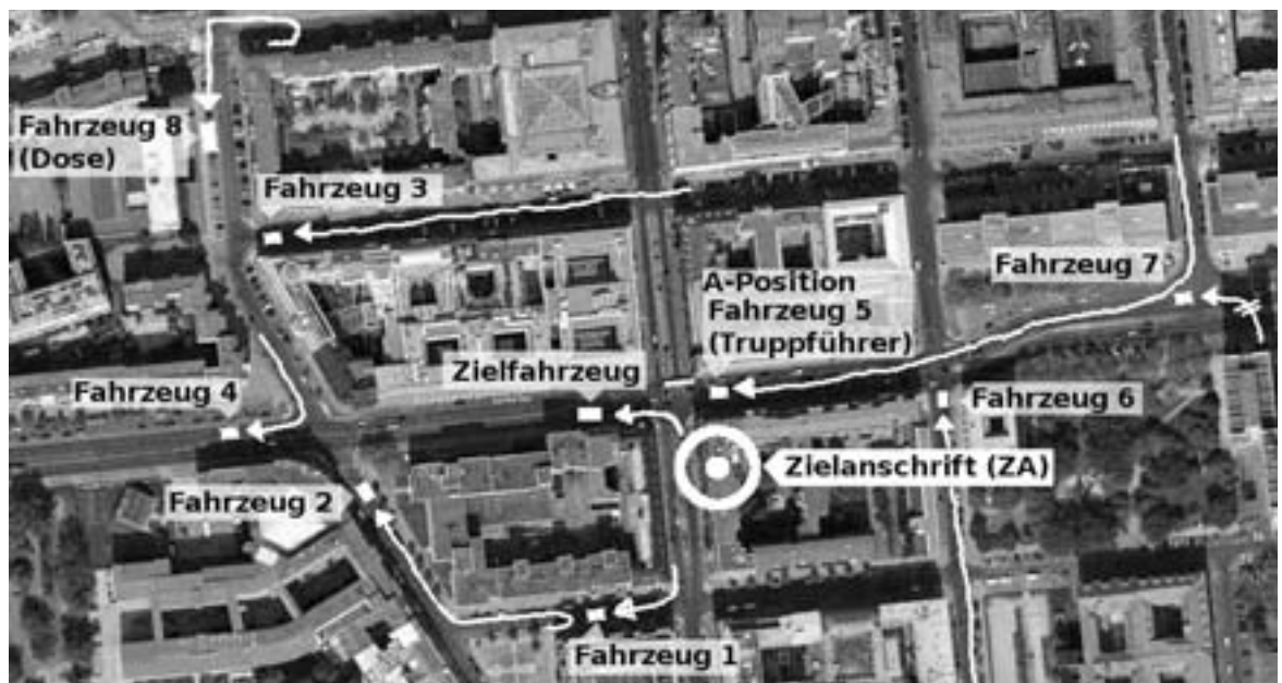
Abb. 5: Bewegung mit Auto. Die ZP entfernt sich mit einem Auto von der ZA. Fahrzeug 1 gibt die A-Position auf und fährt ab, um sich hinten einzureihen. Fahrzeug 5 (Truppführer) hat schnell auf die Meldung von der Abfahrt reagiert und sich in eine günstige Position für "A" gesetzt. Fahrzeug 4 hat sich vor das ZF gesetzt ("in V"), um sich später überholen zu lassen. Die anderen Fahrzeuge ziehen zügig nach (auch Fahrzeug 8). Je nach Ampelphase wird Fahrzeug 2 auch "in V" fahren oder sich hinter Fahrzeug 5 als "B-Position" einreihen. Fahrzeug 7 wendet verkehrswidrig, um den Anschluss zu halten.