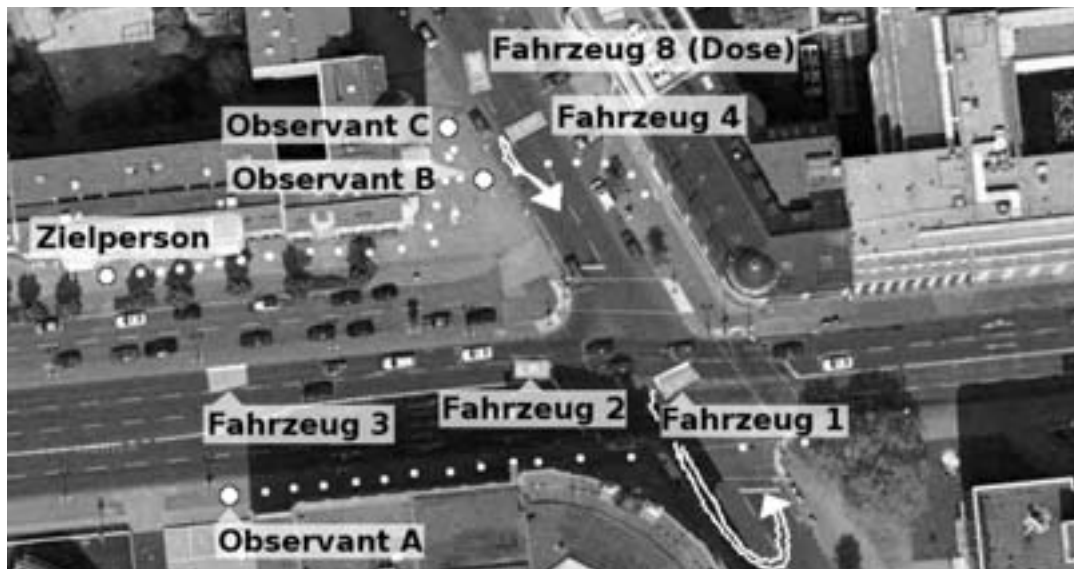
Abb. 9: Bewegung zu Fuß. Die ZP hat überraschend kehrngemacht und geht jetzt die Hauptstraße weiter Richtung Westen. Observant C mußte die ZP passieren und ein Stück weitergehen, um nicht aufzufallen. Er trifft sich kurz mit Observant B, der die Straße überquert hat, um das weitere Vorgehen zu besprechen. Observant A hat im Laufschrift aufgeschlossen und von der anderen Straßenseite aus wieder die A-Position übernommen. Fahrzeug 3 hat die ZP im Blick und meldet ihre Bewegung, muß aber überholen. Fahrzeug 2 ist nun in die Hauptstraße eingebogen und sucht nach einer Gelegenheit, unauffällig rechts zu halten um die ZP nicht überholen zu müssen. Fahrzeug 4 musste den Abbiegevorgang zuende machen und wendet jetzt in der Querstraße, falls nötig steigen die Observanten B und C ein. Fahrzeug 8 (Dose) konnte kein Foto machen und hängt sich jetzt an die Bewegung an. Fahrzeug 1 ist links abgebogen (als frühere A-Position an der ZA etwas zurückhaltend) und wendet zügig in der Querstraße, um den Anschluss zu halten.