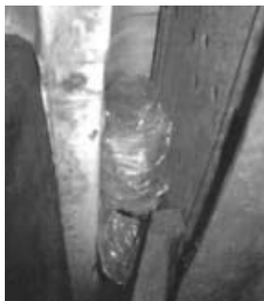
An der Fahrzeugunterseite in einem Hohlraum befestigtes Tracking-Modul. Zum Schutz vor Spritzwasser ist es mit Plastik umwickelt. Im Winter erhöht eine Verpackung auch die Lebensdauer der Batterie (Schutz vor Entladung durch Kälte)